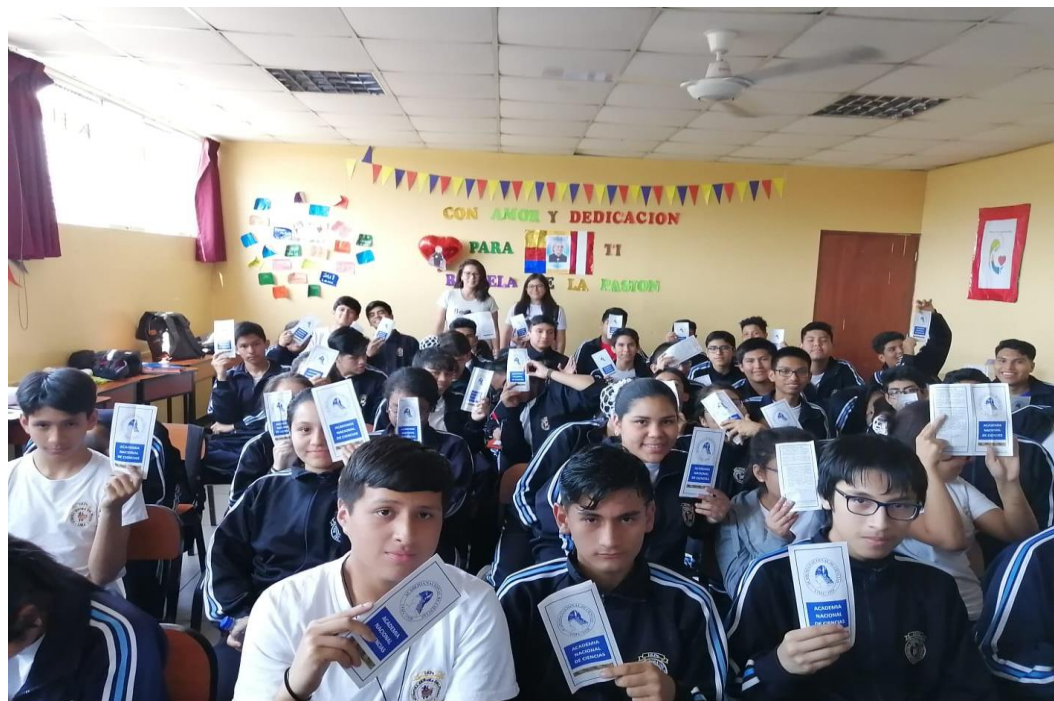
Figura 4. Foto grupal con los alumnos de 4to año de secundaria mostrando los trópicos de ANC entregados.